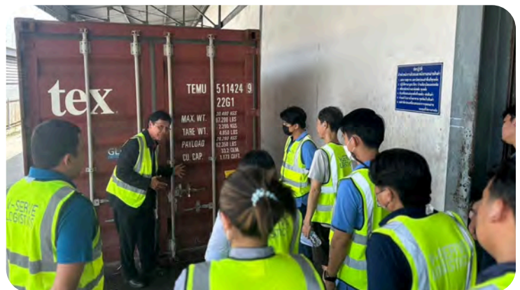
ภาพ : ดูงานการบรรจุตู้สินค้า