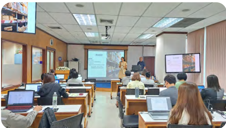
ภาพ : ผู้อบรมสัมมนา ณ สถาบันวิชาการ วี-เซิร์ฟ